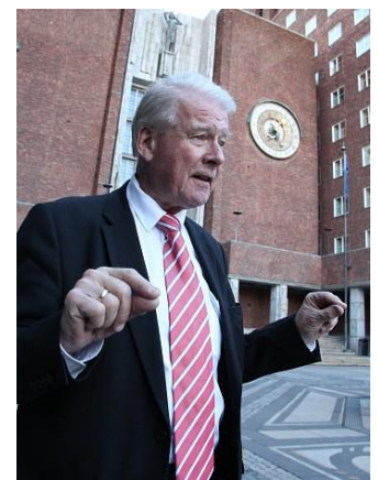
Carl I. Hagen og Frp vil bygge bad i stedet for nytt Munchmuseum.

http://www.nrk.no/ostlandssendingen/vil-bygge-fire-nye-svommehaller-1.11754756