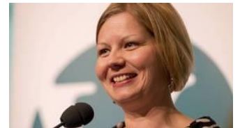
Miljø- og samferdselsbyråd Guri Melby synes løsningen til morgenbaderne og de andre svømmerne i Frogner svømmeklubb er så interessant at hun vil se nærmere på den.

http://www.osloby.no/nyheter/Drommer-om-a-svomme-i-Frognerbadet-aret-rundt-7544453.html